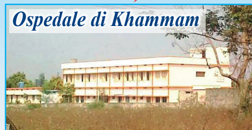
Ospedale di Khammam

In questo povero angolo dell'India, prosegue il nostro aiuto per la costruzione di pozzi d'acqua (ad oggi già scavati 40) e bagni a sostegno dei poveri villaggi della zona. In estate la temperatura arriva anche ai 45°C e la situazione diventa drammatica anche in campo sanitario. Ricordiamo che la somma necessaria per la realizzazione di un pozzo è di 500 euro e di un bagno di 250 euro . Con l'inaugurazione e l'apertura dell'Ospedale Pediatrico "DONO E CAREZZA DELLA MAMMA DELL'AMORE" nel villaggio di Morampally Banjara, dopo aver parlato con il Vescovo, l'associazione propone di "adottare a distanza" i bambini qui ricoverati (tutti sieropositivi o malati di AIDS) proprio per sostenere le spese di gestione, l'assistenza e le cure. Per ogni bambino sostenuto sarà richiesto un contributo annuale di almeno 200 euro .