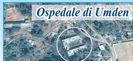
Ospedale di Umden