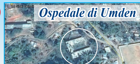
Ospedale di Umden