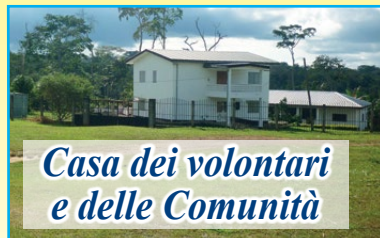
Casa dei volontari e delle Comunità