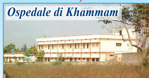
Ospedale di Khammam

In questo povero angolo dell'India, prosegue il nostro aiuto per la costruzione di pozzi d'acqua (ad oggi già scavati 40) e bagni a sostegno dei poveri villaggi della zona. In estate la temperatura arriva anche ai 45°C e la situazione diventa drammatica anche in campo sanitario. Ricordiamo che la somma necessaria per la realizzazione di un pozzo è di 500 euro e di un bagno di 250 euro . Con l'inaugurazione e l'apertura dell'Ospedale Pediatrico "DONO E CAREZZA DELLA MAMMA DELL'AMORE" nel villaggio di Morampally Banjara, dopo aver parlato con il Vescovo, l'associazione propone di "adottare a distanza" i bambini qui ricoverati (tutti sieropositivi o malati di AIDS) proprio per sostenere le spese di gestione, l'assistenza e le cure. Per ogni bambino sostenuto sarà richiesto un contributo annuale di almeno 200 euro .