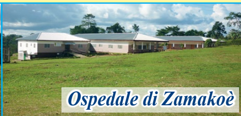
Ospedale di Zamakoè

Dopo la visita al nostro progetto da parte dei responsabili dell'Associazione (novembre 2024) sono stati confermati presso l'Ospedale "NOTRE DAME DE ZAMAKOÈ" tutti i progetti ed i servizi nati per i più poveri. Ogni giorno è garantita la presenza di medici per le consultazioni e le visite. Per il reparto di chirurgia è stato confermato il medico chirurgo che ormai lavora con noi da anni. Ogni mese sono decine ormai le operazioni chirurgiche. Il nostro impegno mensile per sostenere il progetto è di 1.500 euro necessari